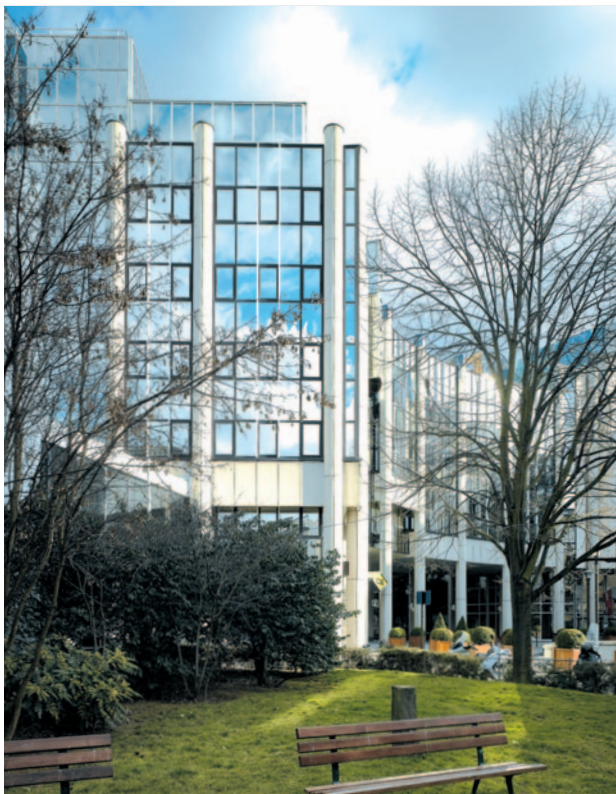
7, place René Clair • Boulogne Billancourt (92)